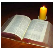
Parole de vie