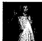
Yvette et Julien Sévigny

Ce dimanche 28 avril, l'église de St-Joseph sera ouverte de 14h à 16h pour souligner le dimanche de la Miséricorde. Il y aura : méditation, chemin de croix, chapelet de la Miséricorde, possibilité de la présence d'un prêtre. Bienvenue à toutes et tous!